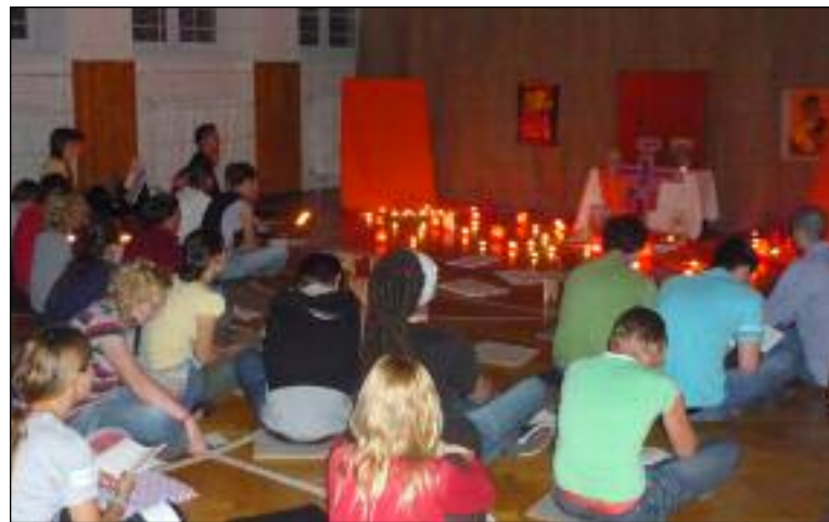
Ze 3. setkání mládeže v Brně