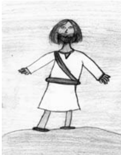
Obrázek nám poslala Nikolka Fundová (7 let)