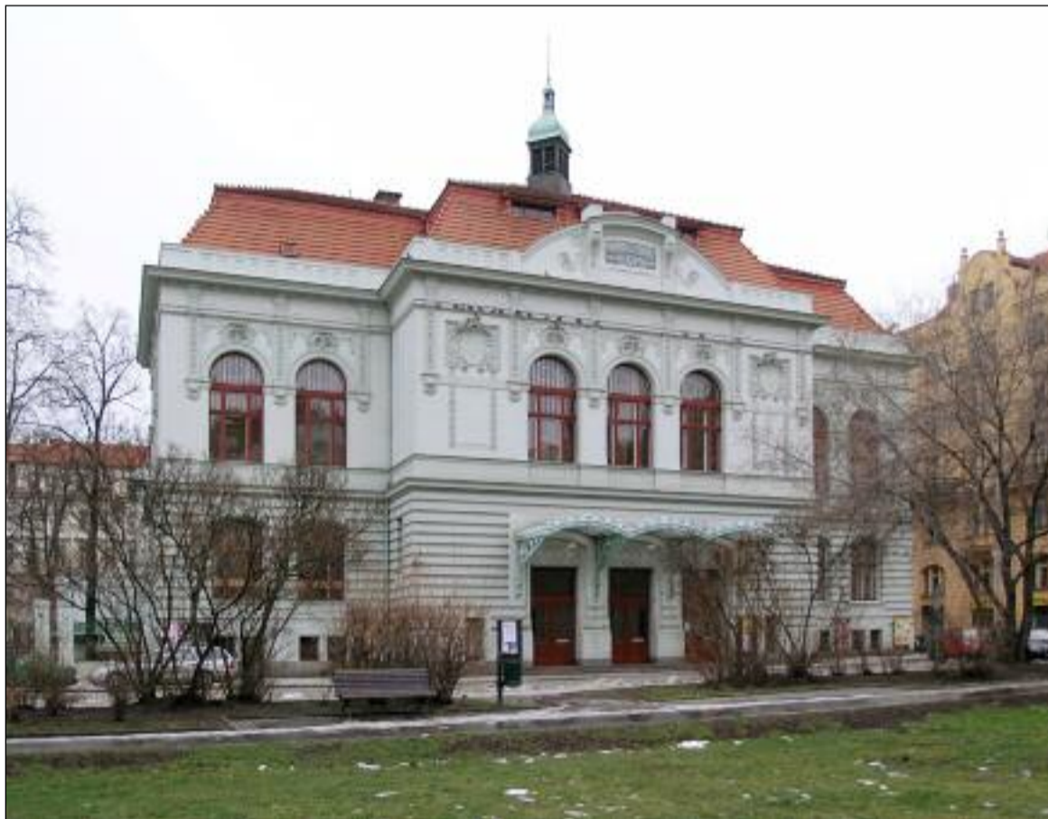
Národní dům v Praze na Smíchově, kde se před 90 lety konal první sněm naší církve - viz str. 3

Muslimové nyní žijí mezi námi v opačném postavení a od křesťanů se učí, jak obstat v sekulárním světě. Blízkovýchodní kultura těžko chápe, že je potřeba vyjednávat prostor pro náboženství. Například, jestliže ústava dovoluje stavět chrámy jedněm, proč by je nesměli mít i druzí, když to zákon dovoluje? Protože muslimové vždy žili s jinověrci, jsou zvyklí na, svým způsobem, náboženský pluralismus. Podobně jen těžko se učí rozumět, že věřící v Evropě žijí