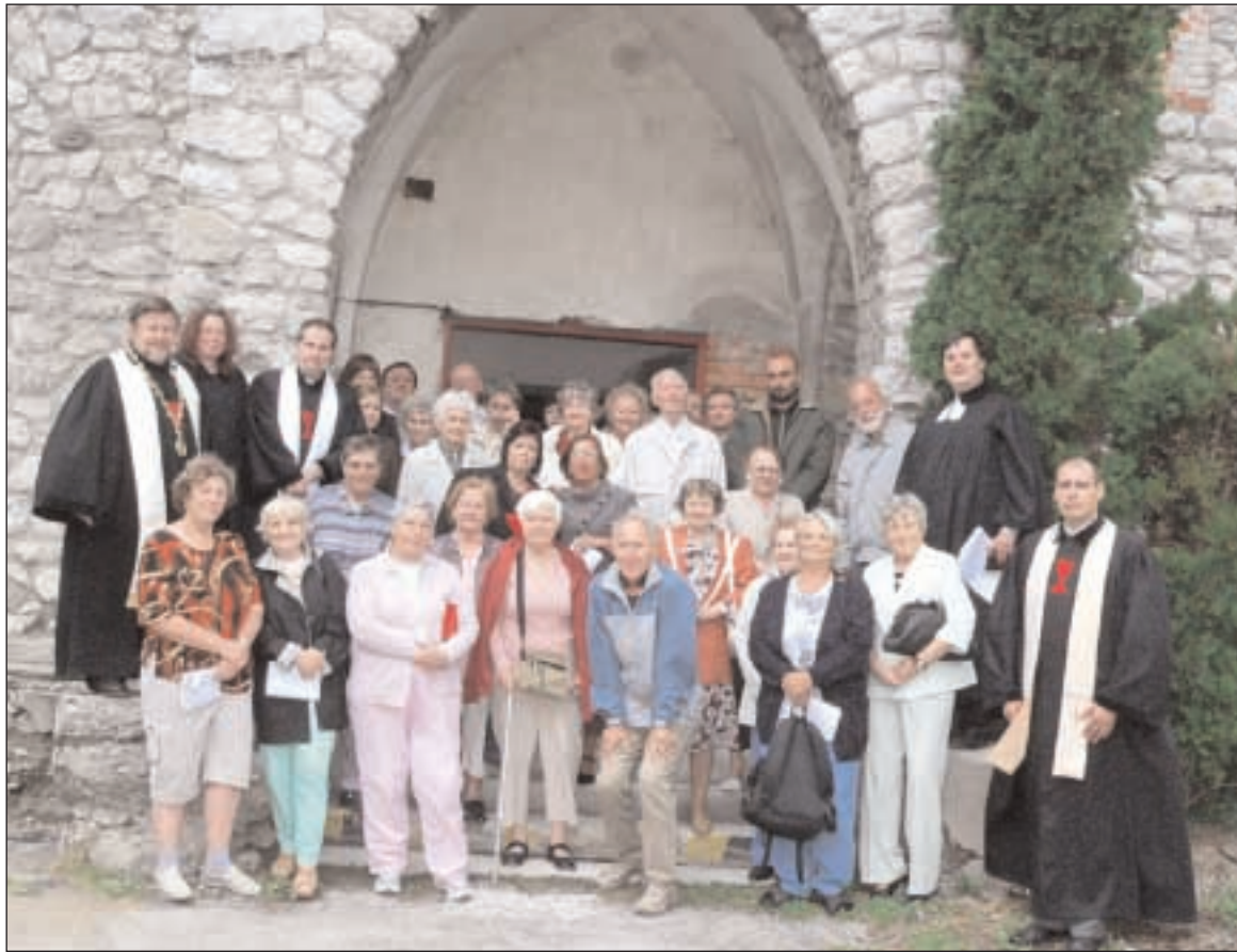
Účastníci bohoslužieb v Liptovskej Osade

Ráno o 10,00 hodine zazneli bohoslužby za prítomnosti liptovských osadníkov a veriacich z Martina a