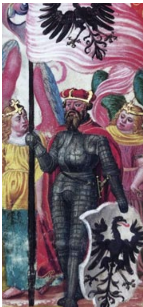
Svatý Václav - iluminace v utrakvistickém Žlutickém kancionálu z roku 1558