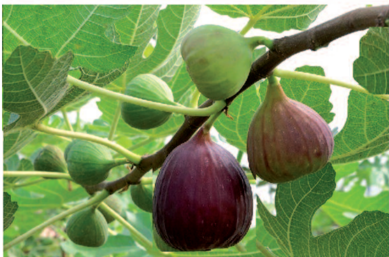
(Řešení z č. 40: Krutí vinaři.)