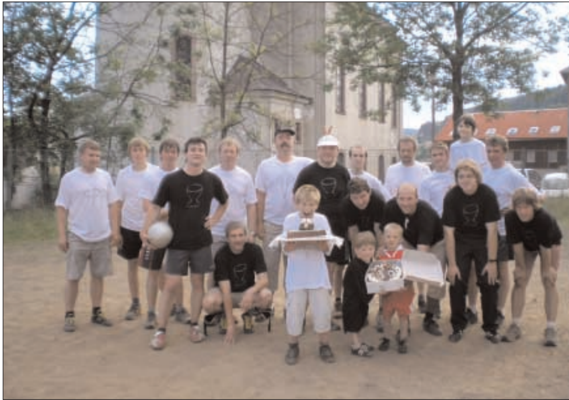
Ve Vysokém nad Jizerou oslavili výročí kaple fotbalovým zápasem s římskými katolíky. Husité vyhráli 6 : 5.

Na Moravě měli velký úspěch. Latinskí kněží sice proti nim sočili, ale marně. Konstantin a Metoděj si vybrali vhodné kandidáty pro duchovenský stav a vzdělávali je, aby národ měl co nejdříve vlastní kněžstvo. V r. 867, když už byli čekatelé kněžství dostatečně vzděláni a připraveni, vydali se s nimi na cestu do Cařihradu, aby tam byli vysvěceni na kněze i biskupy. Římský papež Mikuláš I. je však pozval do Říma a oni doufali, že ho přesvědčí o velkém významu národních bohoslužeb