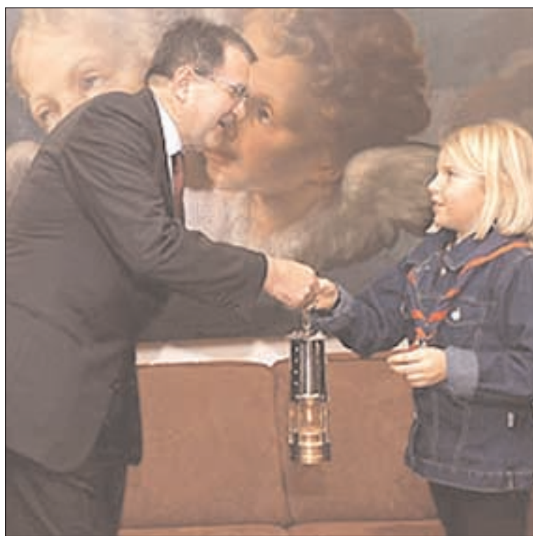
Betlémské světlo předávají děti i v Evropském parlamentu

Zveme vás ke spolupráci a k účasti na tomto pražském setkání a vyzýváme vás rovněž k uspořádání podobných setkání i na dalších místech naší republiky. (Další podrobnější informace je možno získat na sekretariátu ERC v ČR.)