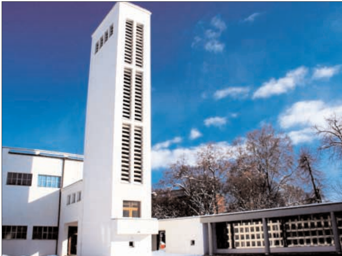
Sbor kněze Ambrože v Hradci Králové, kde se konaly tradiční bohoslužby k výročí vzniku Československa

Třetí, šestý a sedmý den byla jednání věnována dvěma důležitým eklesio-logickým dokumentům: "Povolání být jednou církví" a "Podstata a poslání církve". Za obzvláště významný lze považovat zejména druhý dokument, v němž se rýsuje zřetelná snaha nalézt společný jazyk mezicírkevního dialogu. Rozdělení je v řadě otázek dáno různými chápáním biblických a tradičních výrazů a jejich vzájemnou provázaností. Právě nalezení společného jazyka a přístupu, nebo jak se dnes stále častěji říká nové (ekumenické) hermeneutiky, by mělo pomoci tento problém vyřešit. Dokument je poměrně rozsáhlý (cca 40 stran) a stále se na něm pracuje. Řeší se v něm řada otázek velice blízkých našim Základům víry, jako například téma církve jako Božího lidu či jako obecnosti, ale i velice vzdálených, jako je otázka primátu či koncilarity. Dokument se dokonce snaží najít jakousi