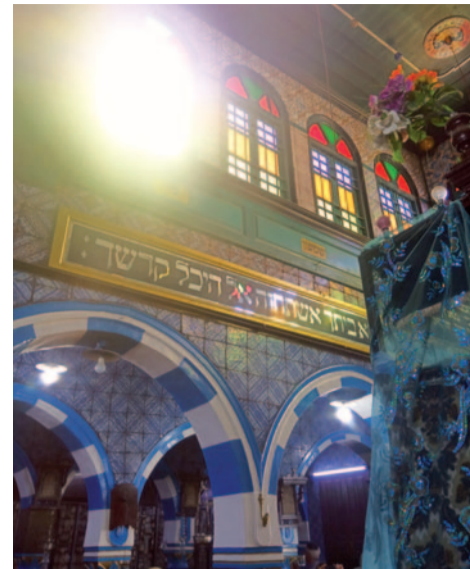
Interiér synagogy La ghriba na tuniském ostrově Džerba

O přítomnosti Židů na území dnešního Súdánu víme jen málo, ovšem je alespoň známo, že v 19. století zde byla založena židovská komunita, která v době svého rozkvětu čítala přibližně tisíc Židů, a která byla v 70. letech 20. století rozpuštěna a patrně zcela zmizela. Na Madagaskaru je rovněž rozšířena legenda o židovském původu Malgašů, kterou mi tam potvrdil můj dobrý malgašský přítel, který je bytostně přesvědčen o své židovské krvi. Na Madagaskaru jsem se s tímto mýtem o židovském původu setkal opakovaně, zejména mezi vyšší společenskou třídou. Dnes je na ostrově několik oficiálních židovských skupin, mezi nimiž nechybí tamější rabíni. V Jižní Africe (a částečně též v Zimbabwe a Zambii) je židovská komunita poměrně početná. Mimořádně zajímavé je zde synkretizování židovství, rastafariánství a křesťanství mezi zimbabwskými Lemby. Když jsem s těmito věřícími hovořil o mystice, při sdílení jejich rastafariánské svátosti, tedy konopí, které je ale nazýváno jako Boží dar mnohými Afričany napříč africkými náboženstvími včetně židovství, křesťanství a islámu, a rozhodně se tedy neomezuje jen na rastafariány, velmi mě zaujalo líčení mystického dosahování stavu zrušení hranice mezi