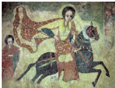
Královna ze Saby na cestě za Šalomounem. Etiopská freska.

Mezi Etiopany jsou hluboce zakořeněny legendy, podle nichž měl nejslavnější a nejmoudřejší izraelský král Šalomoun s africkou královnou ze Saby v 10. století př. n. l. syna Menelika I., zakladatele královského etiopského rodu židovské krve. Mnoho Etiopanů věří, že jim v žilách koluje krev vyvoleného židovského národa. Také věří, že slavná biblická archa úmluvy (jinak též schrána smlouvy, Jz 3,11) je bezpečně uložena právě v Etiopii, konkrétně v Aksumu.