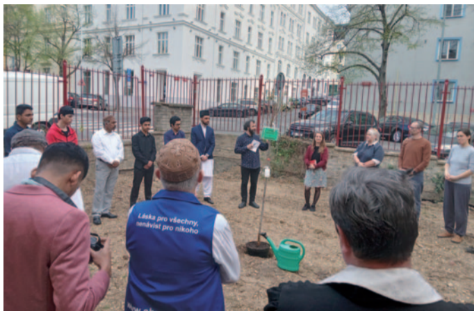
Z mezináboženského a mezikulturního setkání „Iftar s přáteli“ se společným sazením stromku 5. dubna 2024

Kdo sleduje sociální sítě, může zaznamenat, že prostory, které se po rekonstrukci v únoru otevřely, jsou opravdu denně využívány - v souladu s koncepcí, která, jak jsme již uváděli, nabízí zejména: