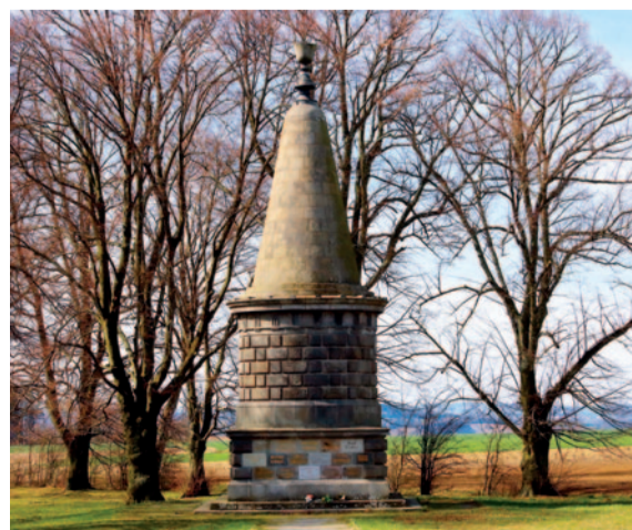
Žižkova mohyla, jaro 2024

Jeden ze 64 základních kvádrů Žižkovy mohyly, která od roku 1874, tedy rovných 150 let, stojí v obci Žižkovo