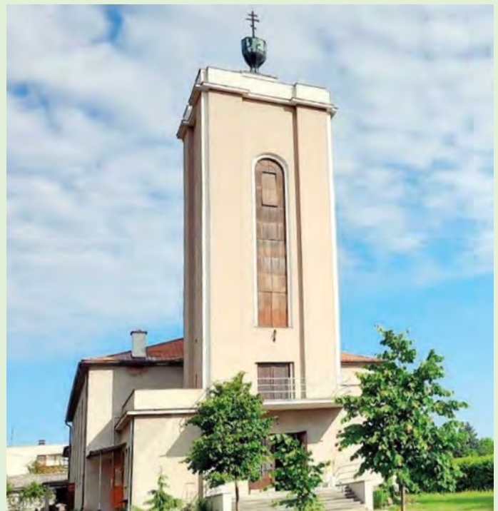
Husův sbor v Lošticích. Dva pohledy do interiéru jsou na zadní straně obálky.