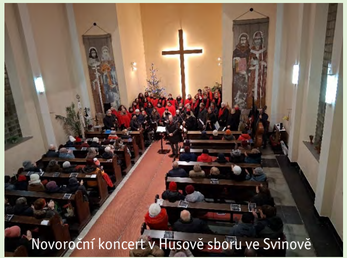
Novoroční koncert v Husově sboru ve Svinově