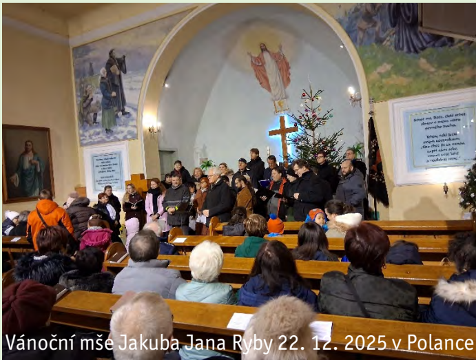
Vánoční mše Jakuba Jana Ryby 22. 12. 2025 v Polance

V Husově sboru v Ostravě–Hrabůvce se 17. 12. 2025 konal adventní koncert, který zprostředkovala Základní umělecká škola v Hrabůvce. Koncert byl velmi hezký, vystupovali úplně maličcí žáci i mládež. Účast byla hojná.