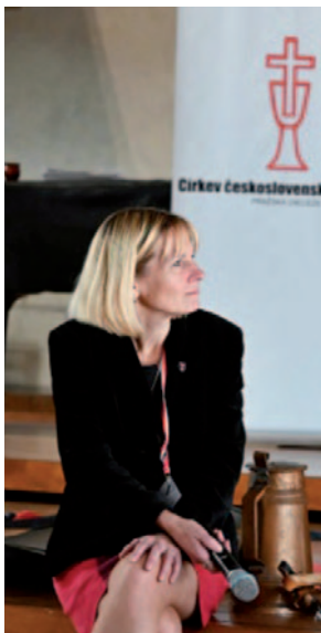
V Betlémské kapli při letošních oslavách 600. výročí J. Žižky.