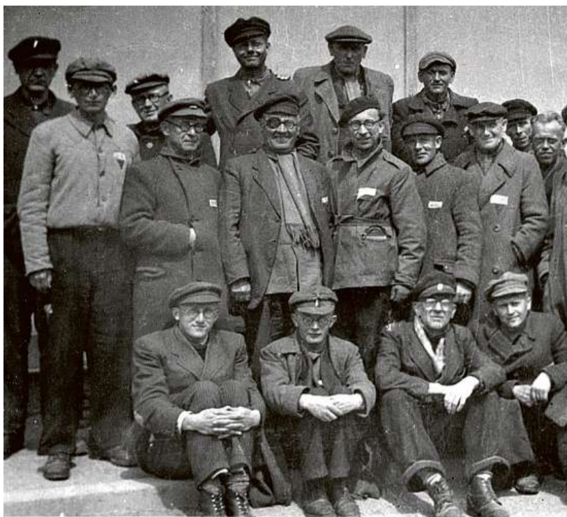
Čeští kněží v Dachau po osvobození lágru

Na závěr si pojďme připomenout známá, ale stále aktuální slova z prohlášení kardinála Josefa Berana na II. vatikánském koncilu. V reakci na potlačování svobody svědomí a vyznání komunistickým režimem v jeho proslovu čteme: „A tak se zdá, že církev v mé vlasti dnes bolestně pyká za hříchy a poklesky spáchané je-