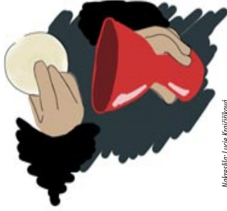
Nakreslila: Lucie Krajčířková

vyjadřuje naše poděkování Bohu za dary, které od něj dostáváme (včetně tohoto chleba a vína), a naši prosbu, abychom v tomto chlebu a víně viděli znamení oběti, kterou za nás podstoupil Pán Ježíš. Bůh už po nás nežádá živé oběti tak, jak bylo dříve zvykem v Jeruzalémském chrámu, nyní mu přinášíme jako výraz díků svá srdce. Vyjadřujeme to slovy, jež uvádějí modlitbu duchovního: „V míru a pokoji podejme srdce svá Bohu v obět svatou! Na usmířenou a v obět chvály!“ Tím chceme vyjádřit, že na Boží lásku chceme odpovědět naší láskou jak k Bohu, tak ke všem lidem.