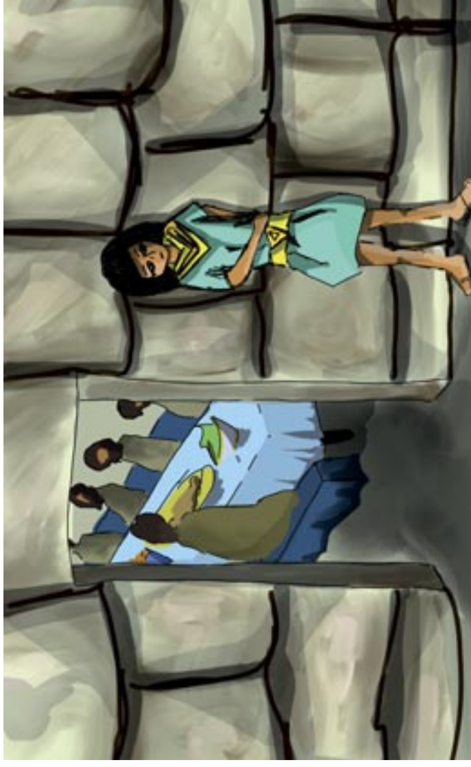
Nakreslila: Lucie Krajčířková

„A tohle musí být váš nejmladší bratr, o kterém jste se mnou mluvili, že je to tak?“ ukázal jsem konečně na Benjamina a zadíval se na něj. Ještě jsem stihl vyhrknout: „Bůh ti buď milostiv, můj synu!“, ale pak jsem musel pospíchat pryč. Přece se nerozpláču přímo před jejich očima! Spílal jsem si za svou přecitlivělost, ale nemohl jsem si pomoci. Benjamin byl tak podobný naší mamince Ráchel! Strašně mě to dojalo. Když jsem si konečně osušil slzy a opláchl obličej, vrátil jsem se a nařídil, aby začali podávat jídlo. Bratři přede mnou seděli pěkně seřazení podle věku od nejstaršího po nejmladšího, ale ačkoliv jsem je neustále pobízel do jídla i pití, bylo znát, jak jsou nesví. Teprve po delší době se trochu uvolnili a uklidnili. Snad nám tedy od toho zvláštního mocného muže opravdu nic zlého nehrozí, začali doufat. A přesně v tu chvíli mě napadla poslední zkouška, které jsem se rozhodl je vystavit.