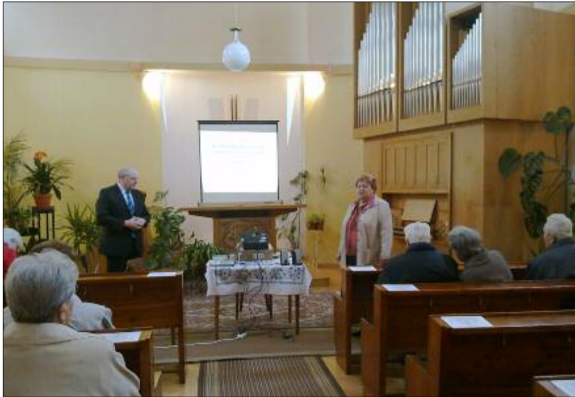
Z vikariátního shromáždění v Kroměříži

ských obcí na Slovensku: Bratislava, Brezno nad Hronom, Košice, Michalovce, Liptovská Osada, Petržalka, Trenčín, Tmava, Spišská Nová Ves, Nové Zámky, Zvolen a Žilina; a čtyři náboženské obce na Podkarpatské Rusi: Užhorod, Mukačevo, Chust a Slatinské Doly. K zmiňovaným náboženským obcím je třeba ještě přičíst téměř na třicet místních výborů. V souvislosti se zánikem Československa vyvstal před bezmála osmisetisícovou církví úkol v podobě nového odpovídajícího názvu. Tato událost z novodobých dějin naší církve by si zasloužila samostatnou kapitolu, pro kterou v tomto článku není prostor. Tak alespoň několika větami. Úvahy směřující ke změně názvu se na církevní půdě poprvé objevily na konci roku 1938. Zcela konkrétní podobu pak události nabraly 20. září 1939, kdy bylo přípisem pana říšského protektora požádáno ministerstvo školství a národní osvěty, aby: „svým vlivem zapůsobilo, aby název ‚církve československá‘ byl v důsledku státoprávních událostí vhodně změněn.“ Ministerstvo 27. září 1939 upozornilo Ústřední radu ČČS, že: „označení ‚československá církev‘ již nevyhovuje daným státoprávním poměrům a že je nutno v souladu s ustanovením církevní ústavy název vhodně změnit.“ Po následných vzájemných jednáních mezi ministerstvem a ústřední radou se jako nejpříjemnější kompromis jevil označení Česká národní církev. Dne 16. listopadu 1939 se však do