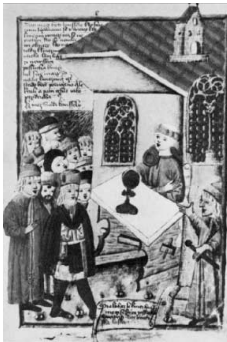
Podávání večere Páně pod obojí způsobou - ilustrace z 15. století