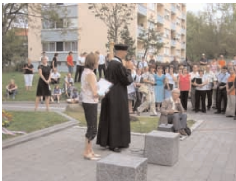
Pražský biskup při kázání v Kostnici před Husovým kamenem