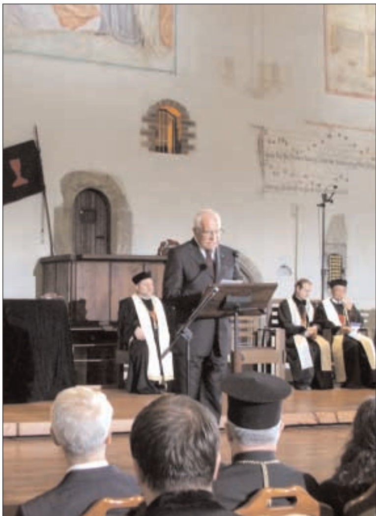
Pan prezident Václav Klaus při projevu v Betlémské kapli