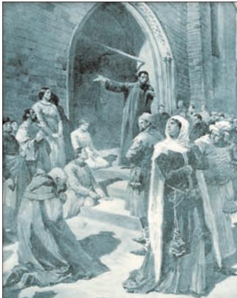
Stanislav Hudeček: Jan Milič z Kroměříže káže lidu