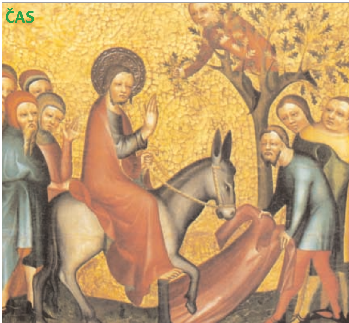
Vjezd do Jeruzaléma - malba z r. 1370 od neznámého německého mistra, Wallraf-Richartz Museum, Cologne

Kolemjdoucí prošli a zmizeli. Mezi ty, kteří se zastavili a zůstali, patřily ženy. Byla to především Marie - matka Ježíše, ale také další ženy. A bylo jich více. „Zpozvalí přihlíželo mnoho žen.“ Některé z nich jsou jmenovány. Mají před Bohem jméno, oproti anonymnímu zástupu kolemjdoucích. Mezi těmi, které se zastavily, byla i matka učedníků Jana a Jakuba (Mt 27,56). Nebylo to tak dávno, co na cestě do Jeruzaléma žádala Ježíše, aby zajistil čestná místa jejím synům - učedníkům Janovi a Jakubovi (Mt 20,20n). A nyní hledí na kříž. Muselo to být pro ni těžké vystřízlivění. Kříž zpochybnuje každý rychle dosažený lidský úspěch. Kříž vylučuje jakékoliv protekcionářství. Kříž činí pochybnou každou lidskou hierarchii a touhu po vzestupu k moci a vysokým postům. Nejvyšším vrcholem cesty Ježíše v tomto světě je Golgota s křížem a nikoli hora pokušení s rozhledem na moc a bohatství tohoto světa, jak je slibuje dábel (Mt 4,8). Matka dvou z dvanácti učedníků hledí na kříž. A stejně tak hleděl na kříž jeden z jejích synů Jan (srov. J 19,26-27). Ten druhý - Jakub není zmiňován. Zřejmě jako ostatní učedníci se ztratil a ukryl. Ženy doprovázely Ježíše až ke kříži. Měly zrak upřený na něho. Byl to pohled plný lítosti, plný lásky. Byl to jistě pro ně zážitek zkla-