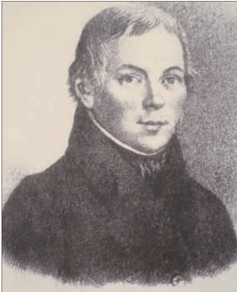
Antonín Jaroslav Puchmajer

Deset let po vydání Thámova básnického almanachu vyšel v roce 1795 pod názvem Sebrání básní a zpěvů almanach nový. Obsahoval básně různých českých literátů a představila se jím skupina básníků v literární historii nazvaná první novočeská škola básnická. Jejím organizátorem i přední tvůrčí osobností byl A. J. Puchmajer, v té době student bohosloví. Formálním pojátkem jeho družiny se stal sylabotnický verš, doporučený Dobrovským.