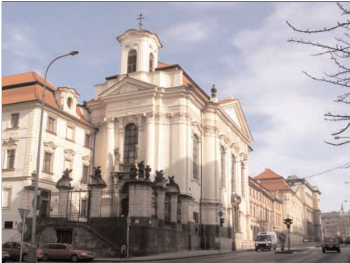
Pravoslavný chrám Cyrila a Metoděje v Resselově ulici v Praze

opraven a byla zpřístupněna i krypta. Památku parašutistů připomíná bronzová pamětní deska s reliéfní postavou parašutisty a duchovního a se jmény hrdinů i jejich ochránců od Františka Bělského, zasazená v roce 1947 na stěnu kostelní krypty. V roce