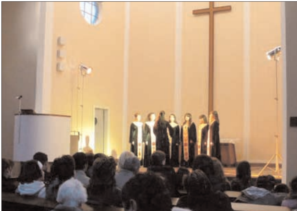
Z koncertu v Brně - Židenicích