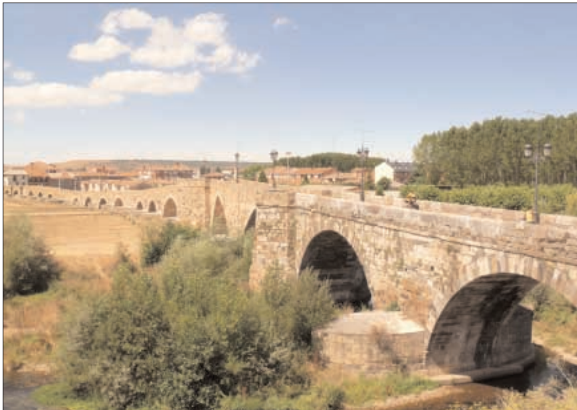
Most v Hospitale de Orbigo