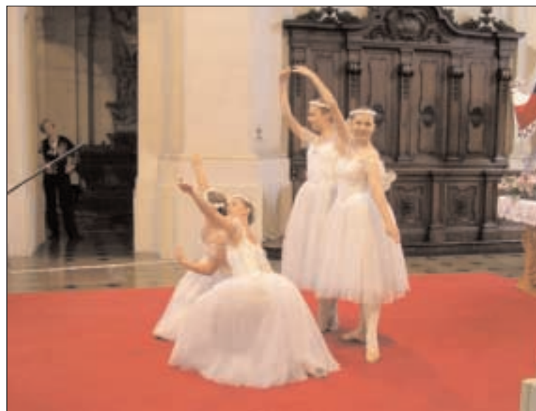
Z festivalu pěveckých sborů - taneční vstup