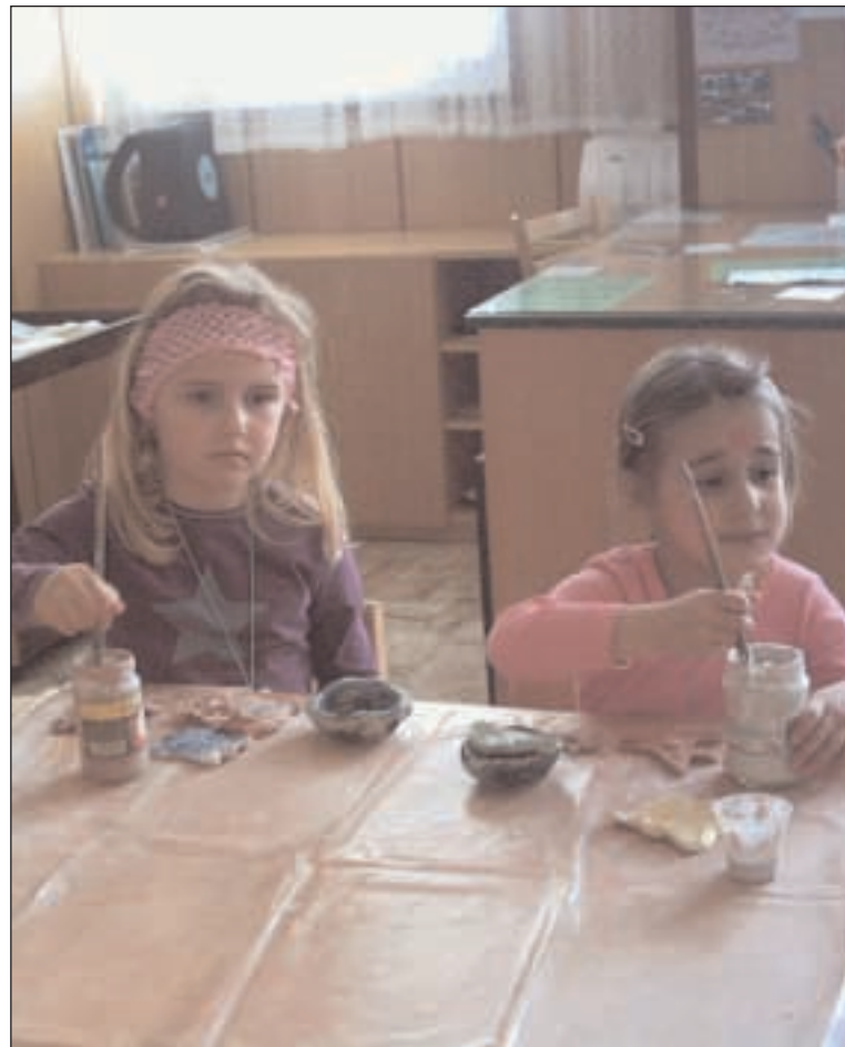
Děti z keramického kroužku Husitského centra