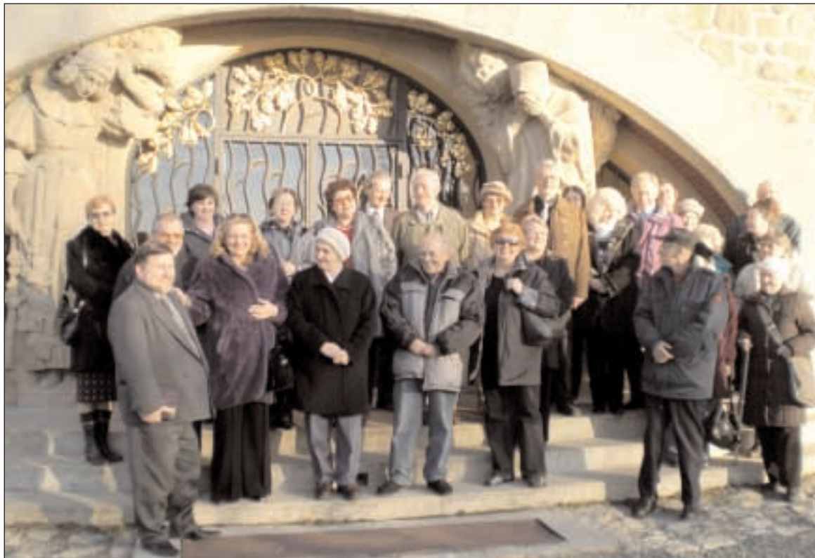
Společná fotografie ze zájezdu bratislavské náboženské obce na Moravu - viz strana 4.