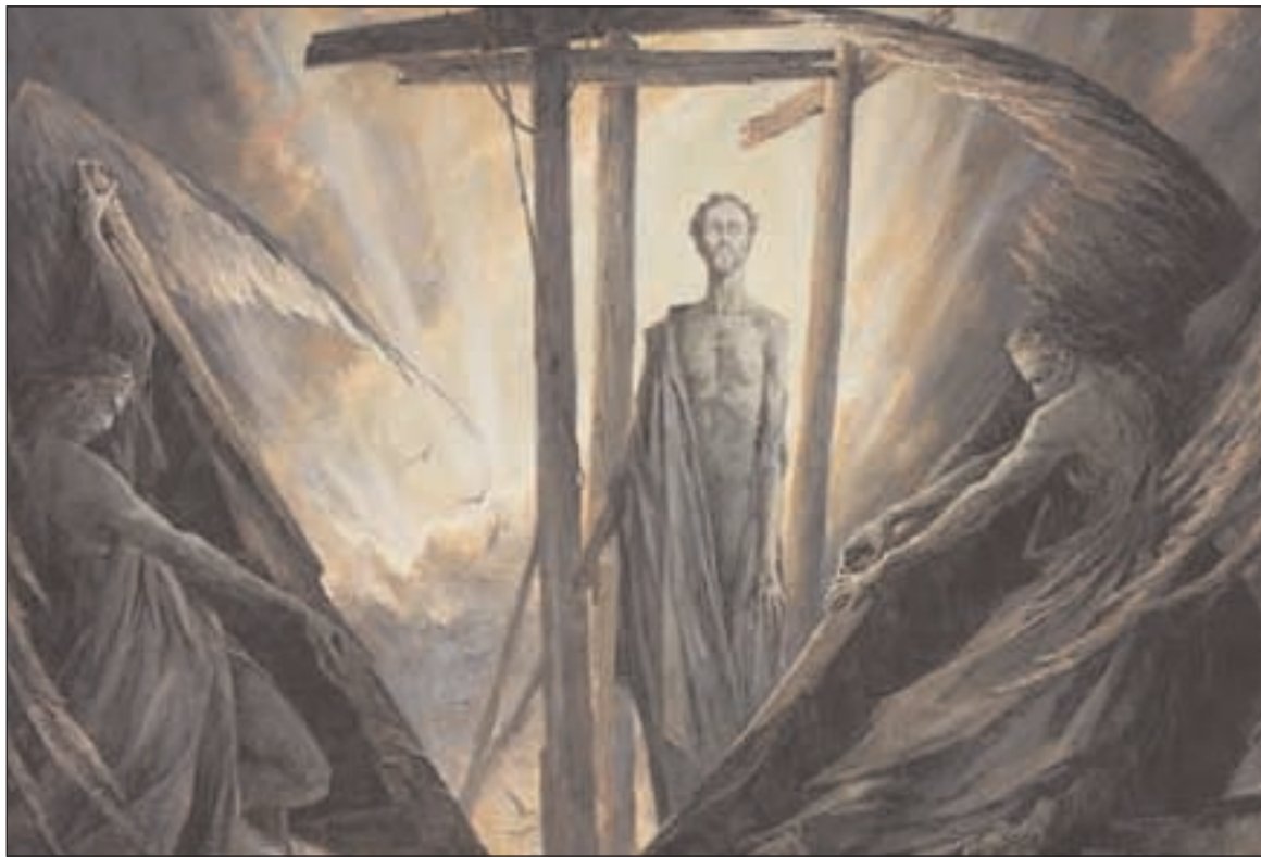
Sergei Chepik: Vzkříšení, 2004 - malba z katedrály sv. Pavla v Londýně

gelia podle Marka zjišťujeme, že živý Kristus se dává poznat jednotlivci – ženě, která ho milovala věrnou, vědeckou a vroucí láskou. Dává se poznat i dvěma učedníkům, kteří vedou živý rozhovor nad Písmem. Dává se poznat celému společenství, a to u stolu při svátosti večere Páně. Svědectví o vzkříšeném Ježíšovi v Bibli je jistě zcela jedinečné. A přece i dnes může člověk zakoušet Ježíšovu přítomnost a blízkost. Jestliže je naše láska vůči němu věrná a