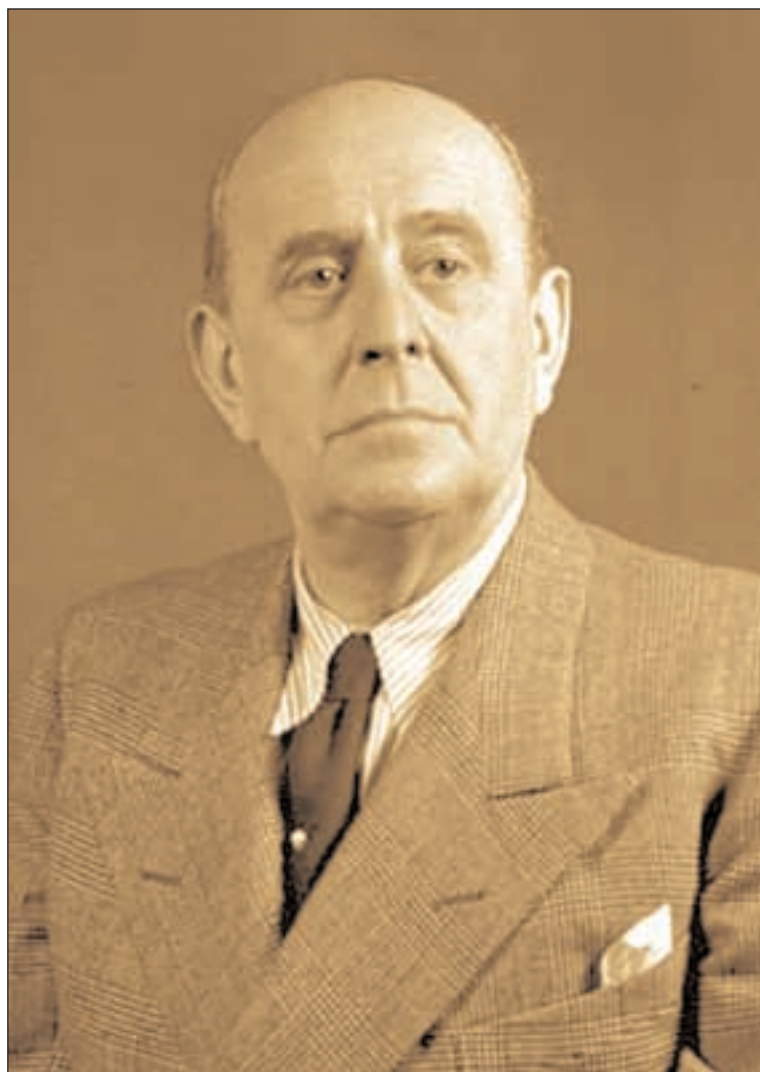
Od úmrtí Jana Masaryka zítřka uplyne 60 let.