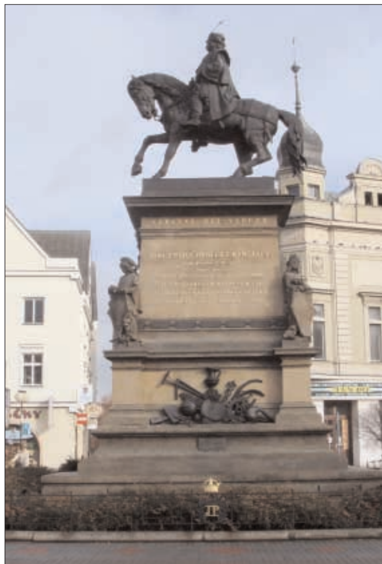
Pomník Jiřího z Poděbrad v Poděbradech