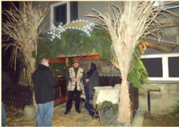
Ukázala se Boží milost, která přináší spásu všem lidem... (List Titovi 2, 11)

V pondělí 13. prosince od 17 hodin na farní zahradě vedle Husova sboru