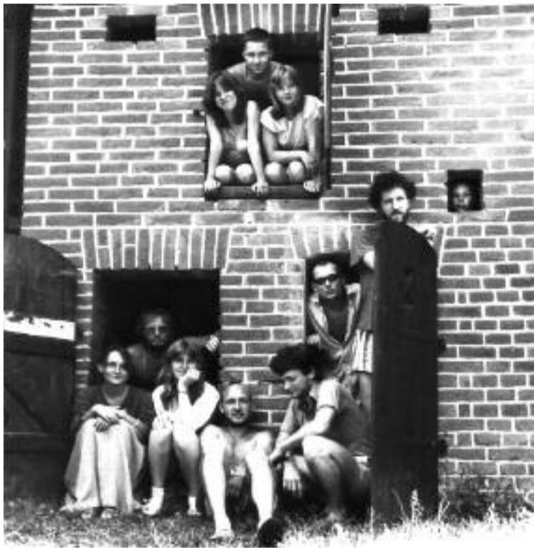
Malovací chalupa v Litohlavech u Rokycan

Svoji básnickou tvorbu Vladimír „Josifek“ Dvořák a další publikovali od října 1987 každý týden na chodbě mezi 3. a 4. patrem Husovy fakulty na nástěnce pod názvem „Akce básně týdne a výtvarné umění teď“. Každý týden se na nástěnce objevovala jedna až tři básně a jedno výtvarné dílo převážně mladých autorů. Díla doprovázela rubrika „hUMOR“, vyčleněno bylo místo pro postřehy, dojmy a názory kolemdoucích přátel i nepřátel, kteří sem tam nástěnku rovnou destrukovali. Společně s kazatelem a pozdějším farářem ČČSH Václavem Žďárským se „Josifek“ začlenil též mezi „psavce“ z křesťanský orientované literární Skupiny XXVI, do jejichž samizdatových Almanachů přispíval a třetí z nich i ilustroval. Na fakultní nástěnce v rubrice Básně týdne poté pravidelně publikoval rovněž přátele ze Skupiny XXVI, z nichž třeba Roman Szpuk se dle jeho vyprávění těšil velkému ohlasu. V dubnu 1989 se přímým pokračovatelem „Akce“ stal studentský časopis „Na cestě“,