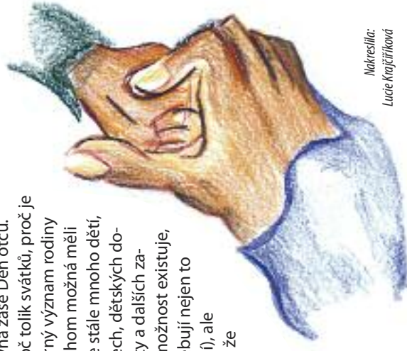
Nakreslila: Lucie Krajčířková