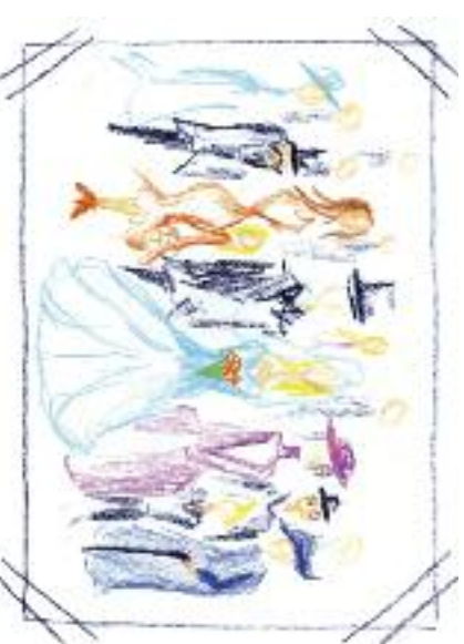
Nakreslila: Lucie Krajčířiková

Blahopřejeme výhercům z březnového čísla (tajaneka: Solidarita znamená nemyslet jen na sebe.):