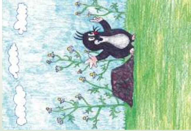
Ilustrace Miriam Chytilová

Od tohoto čísla vám postupně budeme představovat básně patnáctileté Miriam Chytilové, které představují rostliny, jež můžeme najít všude kolem nás, mohou se nám zdát obyčejné, ale skrývá se v nich velká krása a síla. Ke svým básním autorka vytvořila také vlastní ilustrace.