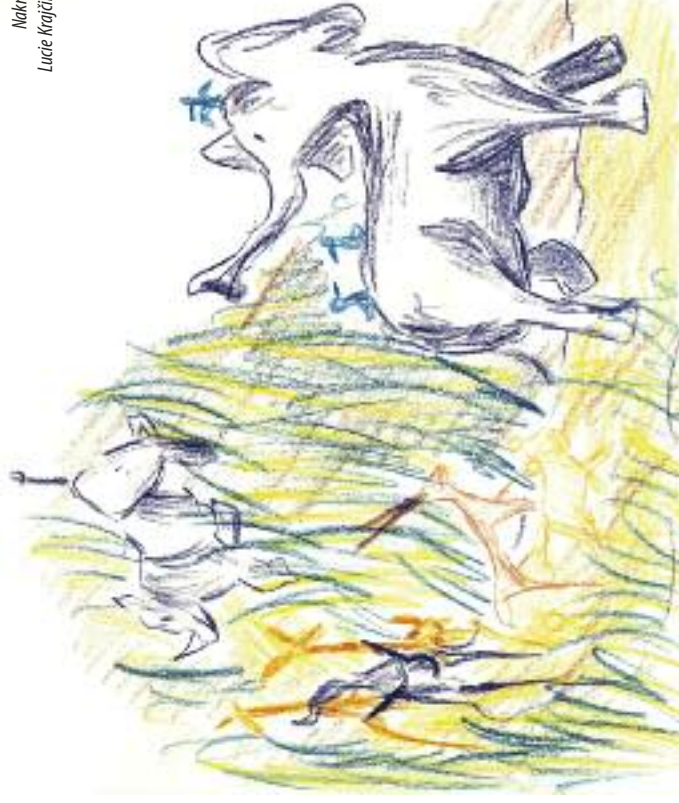
Nakreslila: Lucie Krajčířiková