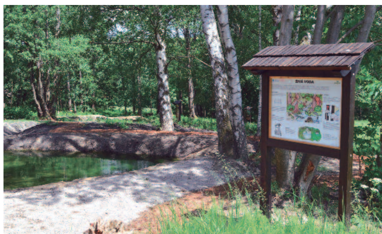
Aareál v majetku ČCŠH ve Farského rodném Škodějově, obklopený lesy, loni nově vybavený třemi naučnými stezkami, které byly představeny br. patriarchou při červenové poutní bohoslužbě.

Z knihy Rok pod nebem s ilustracemi Lumíra Čmerdy