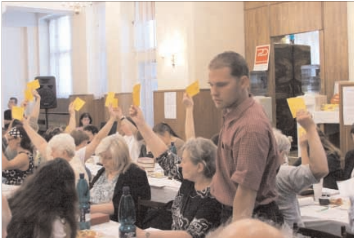
Hlasování na zasedání církevního zastupitelstva v Praze - Dejvicích

Následovala kontrola plnění usnesení minulého církevního zastupitelstva a bylo konstatováno, že se až na jeden bod podařilo usnesení naplnit. Následovala zpráva bratra patriarchy, který se soustředil na tyto hlavní okruhy: duchovní správa, vzdělávání na HTF UK, Charta oecumenica, stát a církev a připomínání patriarchy K. Farského a dalších osobností z naší církve. V první části bratr patriarcha uvedl, že hlavním tématem, kterému je třeba se nyní i dlouhodobě v naší církvi věnovat po stránce teologické, církevně-právní a pastorační, je duchovní správa v ná-