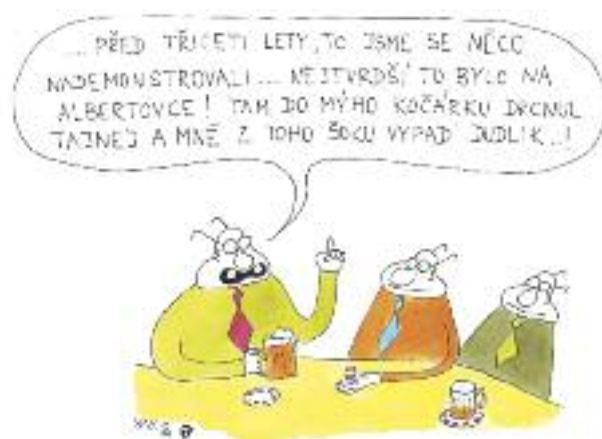
Ilustrace: Tomáš Altman

V roce 1989 nás bylo pár (třeba Košíčkovi), kteří jsme podepsali Několik vět. A stejná situace: To jste neměli, víte, jak to vám nebo církvi může uškodit? Stříh: Ti stejní o pár měsíců později: Nechcete vstoupit do Občanského fóra? - Odpuštěte, ale poslali jsme je „do prádelny“. A pak přicházely kalendáře Blahoslavy a jejich schematismus - jako předtím, tak i potom stejný. Nejmenuji. Kdo pamatuje, ví nebo pamatovat nechce nebo už neví. Nevzpomínám na to se zapřeklou zatrpklostí, natož ve zlém. Naopak. Připomínám to spíš s poučeným humorem jako znamení času. Byla to přece skvělá škola sebereflexe vlastních slabostí a schopnosti odpustit druhým. Po nástupu do biskupského úřadu 1999 jsem na následný církevní sněm zaslala výzvu k pokání za nás všechny v církvi. Docela humorně - a doufám, že nechtěně - zůstala nerozdána, zavřena v jakémsi autě před mikulášským chrámem a až později, trochu upravena, vyšla tiskem. Ale stejně: nešlo přece vůbec o veřejné písemné prohlášení lítosti a omluvy. Šlo o zcela skutečné a konkrétní omluvy pronásledovaným duchovním, nuceným odejít ze služby církve se ztrátou státního souhlasu, které se dělo s církevním přitakáním. Nenalhávejme si. Jen v olomoucké diecézi jich bylo snad 17. Kolik z nich odcházelo na věčnost rozčarováno nepohnutelností církve, která dělala