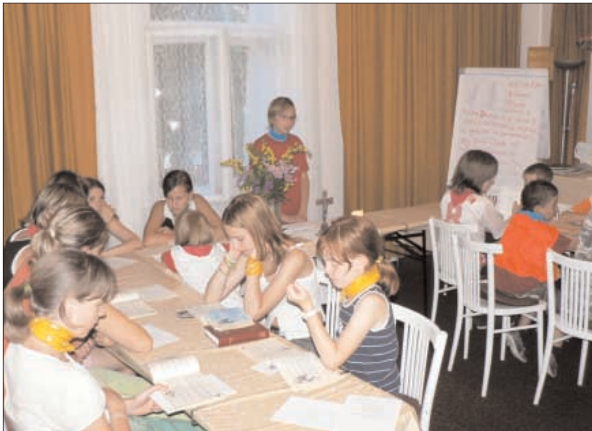
Na křesťanských táborech se děti nejen pobaví, ale naučí se také pracovat s Bibli

A to je také to, v čem je tento tábor tak výjimečný. Učíme se zde také slušnému chování, hraní "fair play" a dobře vycházet s lidmi, což znamená brát zřetel na různé handicapy druhých, když je někdo malý, velký, chytrý nebo méně chytrý, a ke všem se chovat co nejlépe. Neboť v 1. Samue-