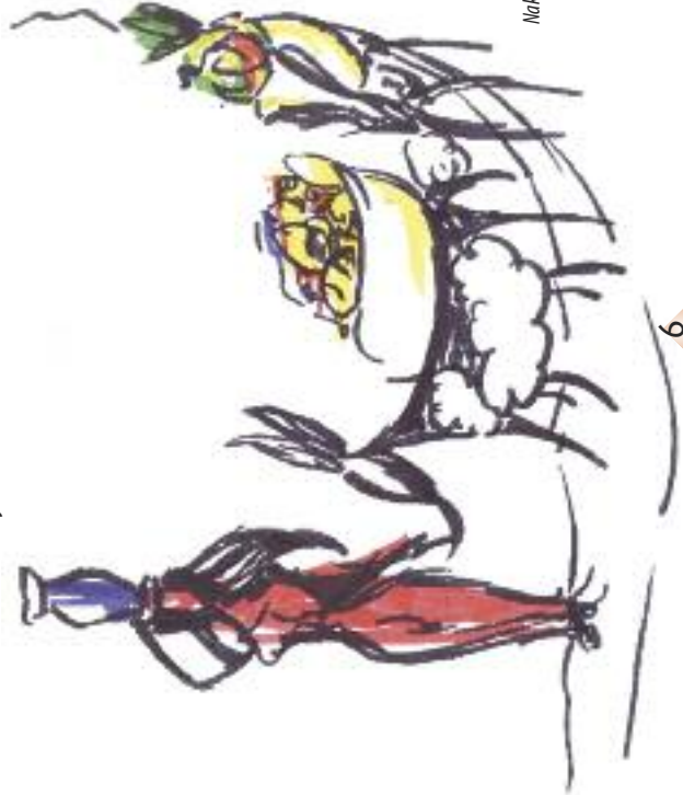
Nakreslila: Lucie Krajčířková

Když se to dozvěděl David, požádal Abígajil, aby se stala jeho ženou. JK