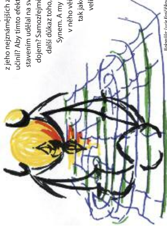
Nakreslila: Lucie Krajčířková