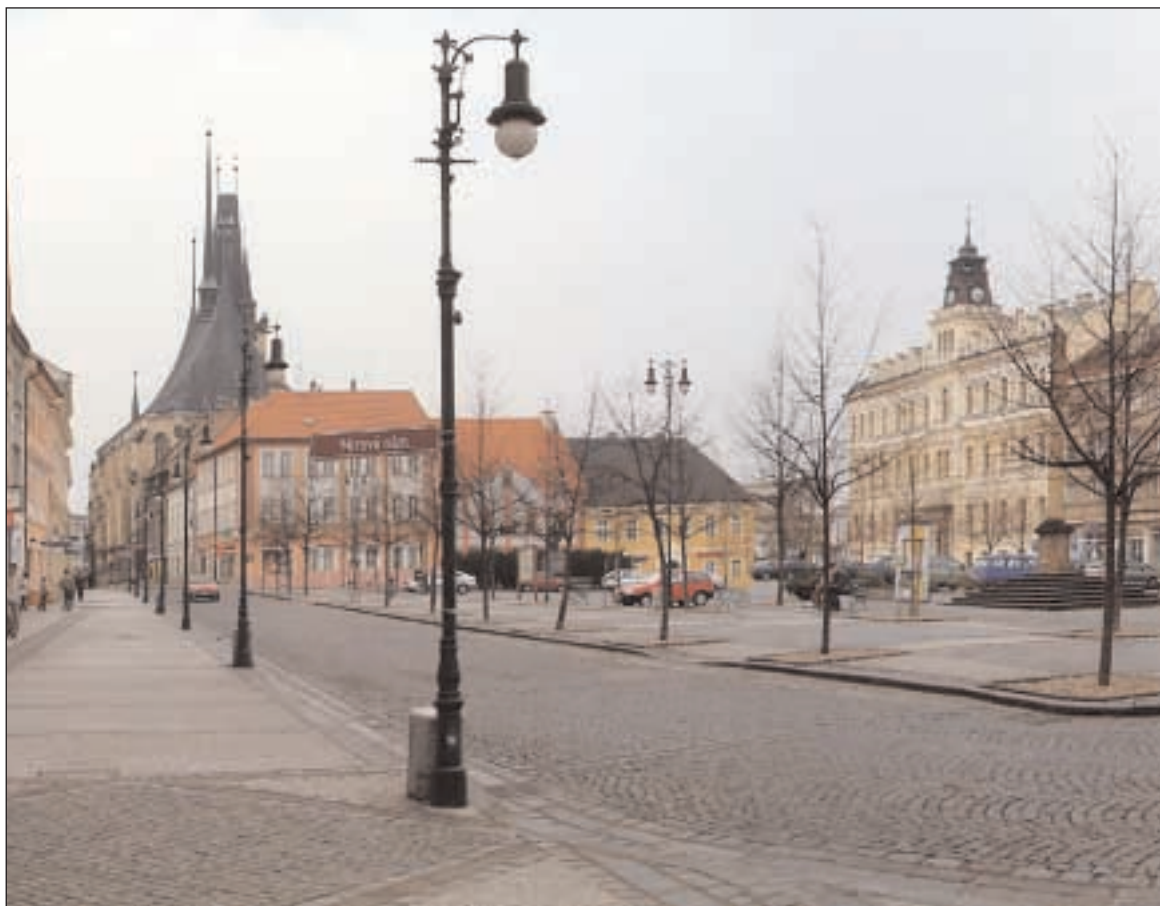
Lounské náměstí na sklonku podzimu

Květoslava Salmonová, LDK Dialog na cestě