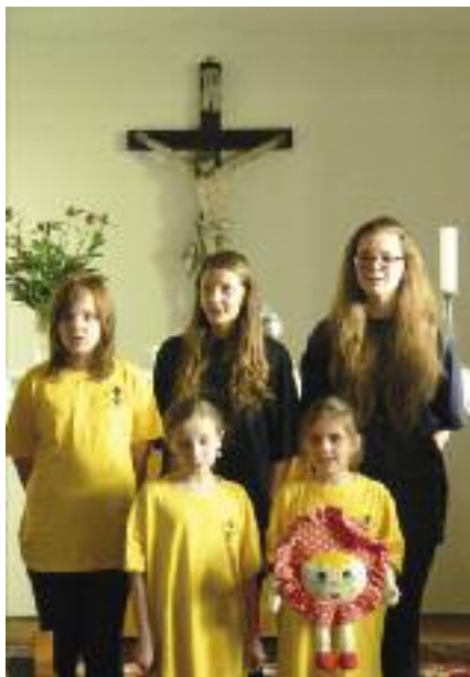
Sbor Sluničko při ZŠ Krnov při Noci kostelů v Ostravě-Hrabůvce.

a spolky CČS účinkovaly nejen při bohoslužbách, ale i při dalších akcích. Jednalo se např. o různé oslavy, koncerty, besídky, přednášky a akademie, které samy pořádaly nebo je organizovaly náboženské obce. Na nich zpívaly i světský repertoár a prostřídávaly jej instru-