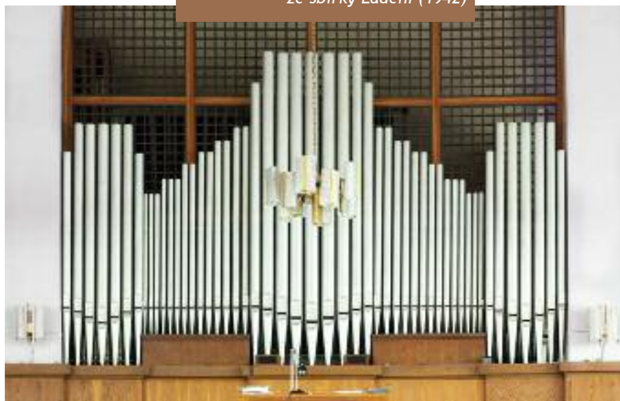
Varhany v pražském vršovickém sboru postavené firmou Rieger-Kloss v r. 1953