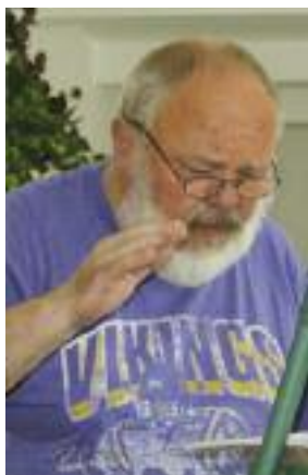
Při zkoušce sboru

A přece znám jednu naši „náboženskou obec“, kde se hraje a zpívá od rána do večera (co do večera, přímo do noci), kde se slaví překrásně nedělní liturgie a konají se pobožnosti dvakrát denně a účast na nich je velká, kde se všichni členové včetně duchovních, kteří společenství vedou, k sobě chovají skutečně bratrsky a sestersky, pomáhají si a radí si, žijí pospolu. V té obci se jezdí na poznávací výlety, setkávají se u biblické večere i na poněkud uvolněnějších večířkách zvaných „všeobecným veselím“. V té obci se pořádají veřejné koncerty, na kterých účinkují varhaníci, sóloví zpěváci i pěvecký sbor té obce. Tady Čechové společně s Moraváky (na ty rozhodně nesmíme zapomenout) skutečně žijí hudbou! Mám to tam moc rád a jezdím tam pravidelně. Když tam nejsem, stýská se mi. Někdy si říkávám, že „tam je moje skutečná náboženská obec“. Jako spirituál v té obci pravidelně působí emeritní patriarcha naší církve, zdatný zpěvák a houslista, který družně a skromně usedá s ostatními ke společnému stolu a je radost s ním diskutovat, protože on má nejen velké vzdělání a bohaté životní zkušenosti, ale také nevídanou pokoru a víru a duchem je velmi, velmi mladý. Celou tu obec vede kantor a farář, bodrý a vtipný Moravák, zdatný zpěvák a varhaník, člen Pěveckého sdružení moravských učitelů. Svá kázání obvykle začíná oslovením „moji draží“ a nikdy to nezní nikterak formálně. My