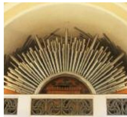
Pohled na kůr pražského dějvického sboru vyvolává představu husitského slunce.

Pak ihned listovala ve Zpěvníku a velmi často s hrůzou zvolala: „To my neumíme.“ Farář ale nerezignoval na svou