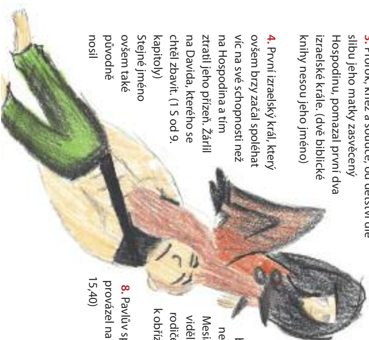
Nakreslila: Lucie Kojáříková

8. Pavlův spolupracovník, který jej provázal na druhé misijní cestě. (Sk 15,40)