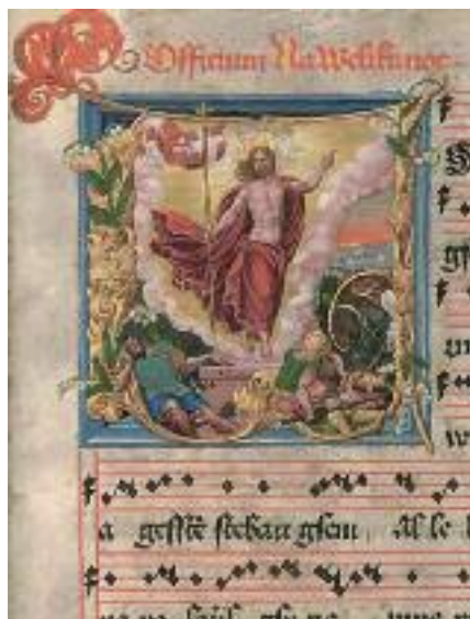
Ze Žlutického kancionálu

dine, pomiluj ny a píseň Svatý Václave z 12. století. K duchovním písním předhusitské doby náležejí Buoh všemohúci