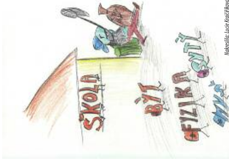
Nakreslila: Lucie Krajčířková

V tomto čísle vám přinášíme poslední část příběhu o Mojžíšovi jako ukázkou z této Komiksové bible, jež vyšla v Karmelitánském nakladatelství.