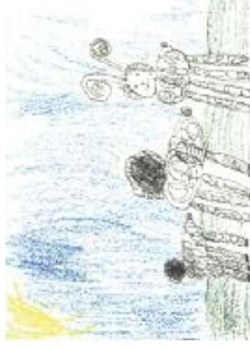
Nakreslila: Johanka Kalenská - 7let