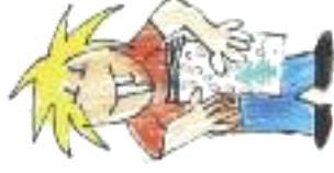
Nakreslila: Lucie Krajčířková