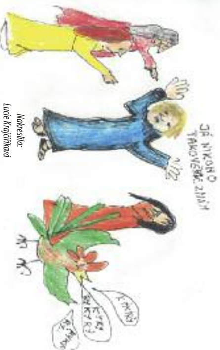
Nakreslila: Lucie Krajčířiková