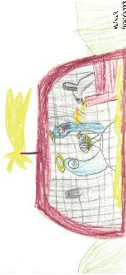
Nakreslila: Ferdá Krajčířková

Řešení ze str. 2: 1. Potifar; 2. Penina; 3. Pinchas; 4. Pekachjáš, Pekach; 5. Šimon Petri; 6. Pilát Pontský; 7. Prochor, Parmén; 8. Pavel z Tarsu; 9. Priscilla