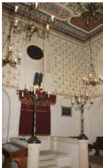
Synagoga v Turnově