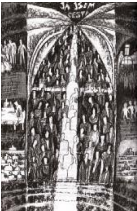
Kresba autorky článku

Naše církve je převážně společenstvím starších lidí, a měla by se proto o ně umět postarat v jejich potřebách: proto komise pro práci se seniory a s veřejností. Dostat do popředí veřejného povědomí účtu ke stvoření, k životu, ke stáří – tyto dnes tak opomíjené hodnoty – znamená věnovat