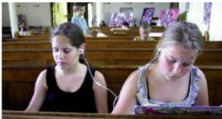
Desátého června proběhla v Husově sboru ve Vratimově umělecká dílna. O pracovním a uměleckém nasazení dětí se můžete přesvědčit na fotografii.