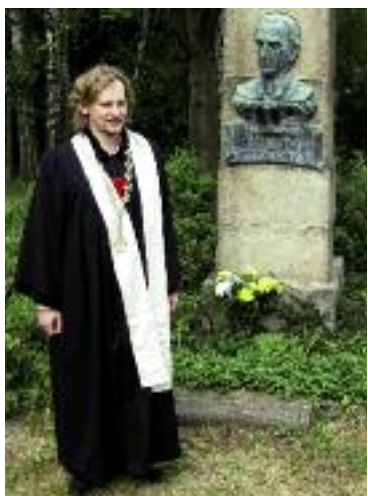
Z letošního setkání u památníku dr. Karla Farského ve Škodějově

Bratře biskupe, uplynul rok od chvíle, kdy vyšla v Českém zápasu zpráva o Vašem zvolení biskupem Královéhradecké diecéze se stručným rozhovorem s Vámi, kde jste mimo jiné uvedl krásnou větu, že „člověk je poutník, co vždy za sebou zanechává jisté stopy a ani nemůže projít životem, jakoby nebyl...“ Je to samozřejmě ještě relativně krátká doba, ale povězte, jak byste charakterizoval stopy, které jste zatím v diecézi v nové službě zanechal? Pokračujete s aktivitami na poli politickém a kulturním, o kterých jste se tenkrát zmínil?