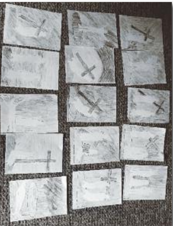
Obrázky křížové cesy nám posílaly děti z Příbrami