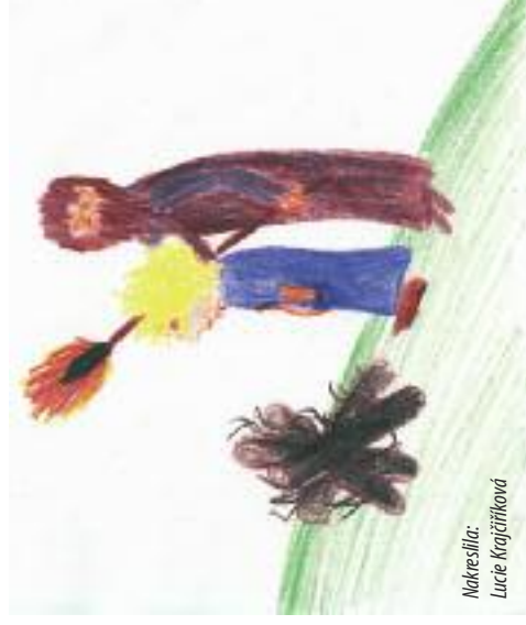
Nakreslila: Lucie Krajčířková