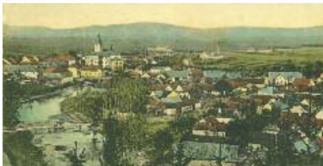
Loštice – výřez z pohlednice. Vlastivědné muzeum v Šumperku, sbírka Havelkova muzea v Lošticích, H

votní cesta jasem anebo temnotou? To ponechávám na Tobě, můj Bože, Tvé otcovské lásce svěřuji svůj další osud, neklesám na mysl a nebojím se, protože Ty činíš všechno prozíravě k dobrému, „v pravici Tvé spočívá milující náklonnost“. Svým dnešním krokem ale přebírám sladké i náročné povinnosti, začínám nový list knihy života, otvírá se přede mnou nová škála odpovědnosti. Je snadné ubírat se životem pod vedením milujících rodičů, ale něco docela jiného je dostát čestně všem požadavkům blažené dvojrole manželky a hospodyně a sama určovat svou další cestu.