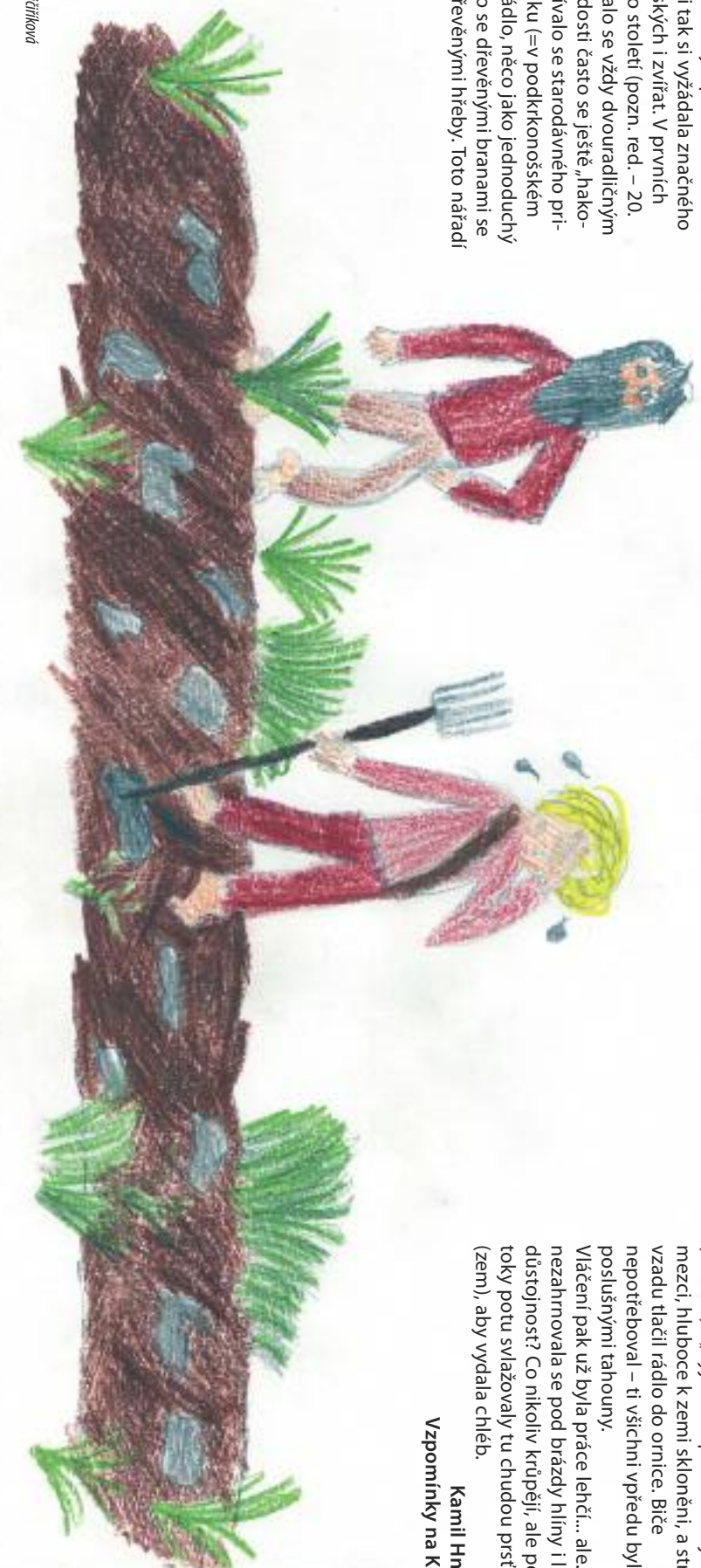
Nakreslila: Lucie Krážířková