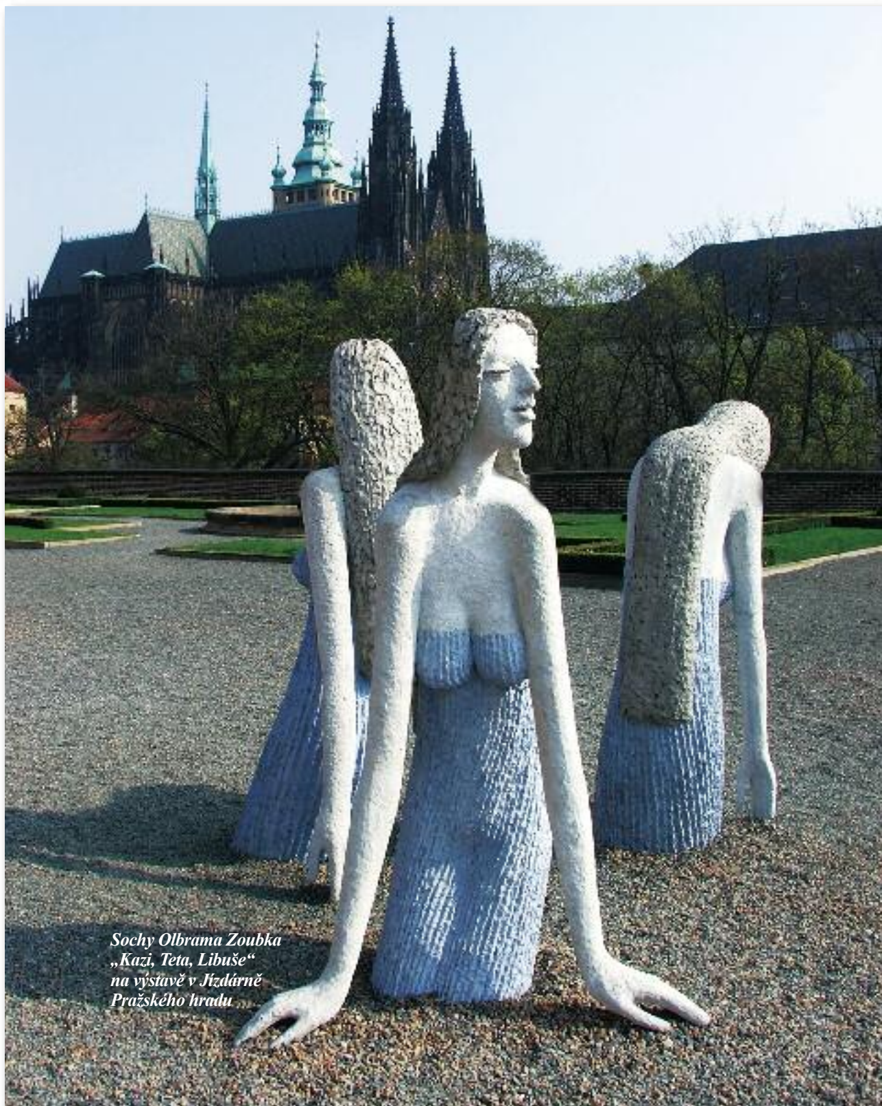
Sochy Olbrama Zoubka „Kazí, Teta, Libuše“ na výstavě v Jízdárně Pražského hradu