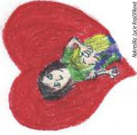
Makreslilar: Lucie Krajčířiková

B ěhem roku se v kalendáři objevuje řada svátků, které pro většinu lidí znamenají radost a důvod ke slavení. Vždycky jsou tu ale i tací, kterým takový svátek přináší spíš smutek a slzy. Například Vánoce. Většina lidí se těší, jak se rodina sejde u slavnostního stolu, na dárky, kterými se chtějí vzájemně potěšit. Jsou ale i lidé, kteří rodinu nemají a jsou sami. Právě o Vánocích pak na ně jejich osamělost dopadá ještě mnohem tíživěji. Nebo v únoru se poslední dobou i u nás slaví svátek zamilovaných – svatý Valentín. Co když ale někdo právě svou lásku nedávno ztratil?