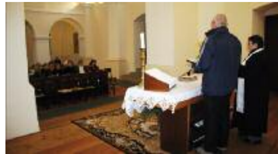
Z ekumenické bohoslužby ke Dnům J. A. Komenského v Chrámu Mistra Jana Husa