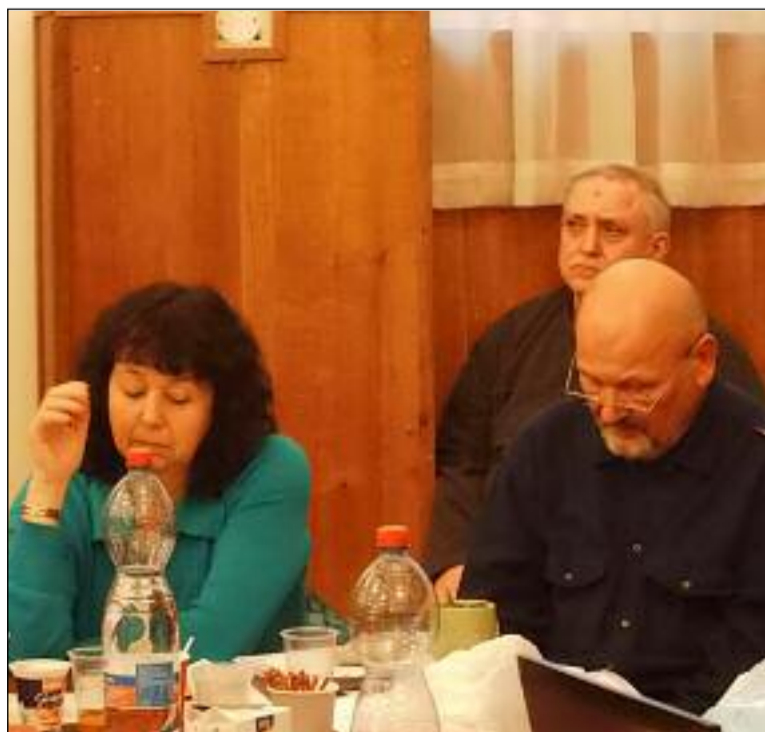
Z církevního zastupitelstva - zástupci olomoucké diecéze