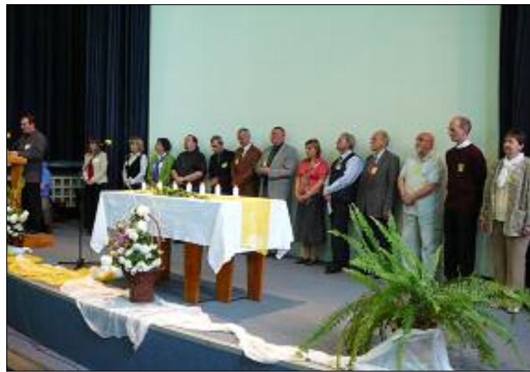
Zahajovací modlitba na Run4unity