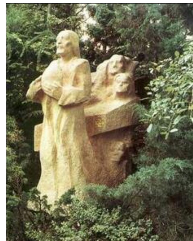
Roman Podrázský: Poslední večeře