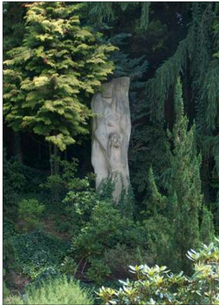
Roman Podrázský: Vzkříšení