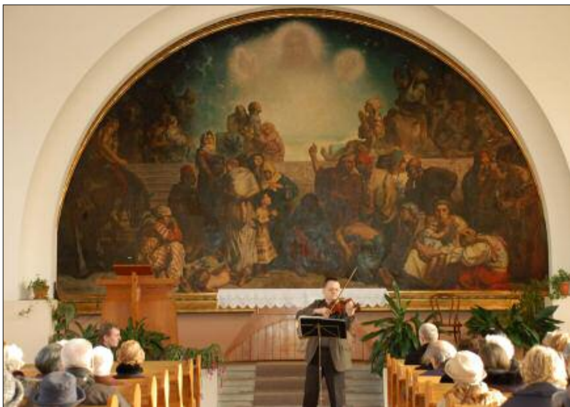
100. výročí narození autora obrazu Světlo pravdy připomněli v Husově sboru v Brně-Tuřanech