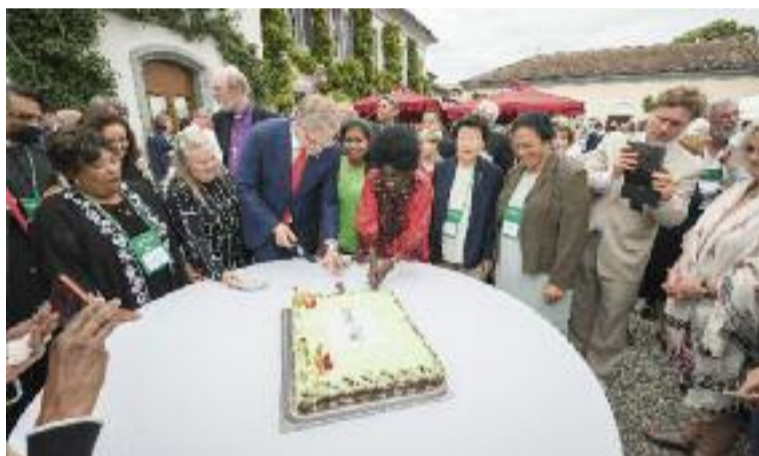
Krájení dortu na zahradě Ekumenického institutu v Bossey.