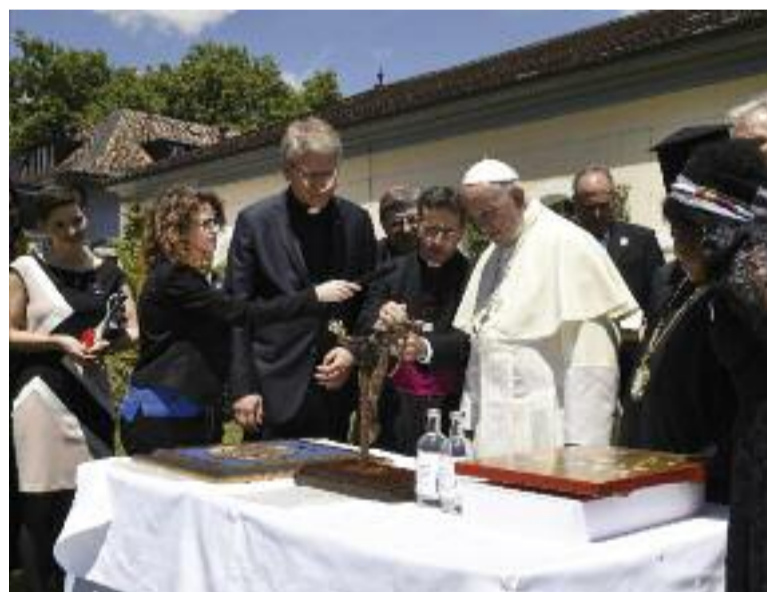
Papež František přináší dary a také přijímá ikonu s obrazem Ježíše Krista jako vinného kmene.

Světová ekumena se nyní ocitá na prahu dalšího stupně vzájemného Dokončení na str. 4