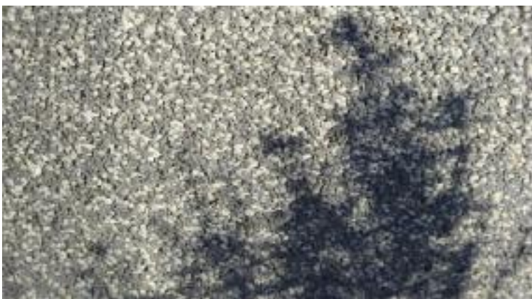
Stín tymiánu, foto Václav Kovalčík