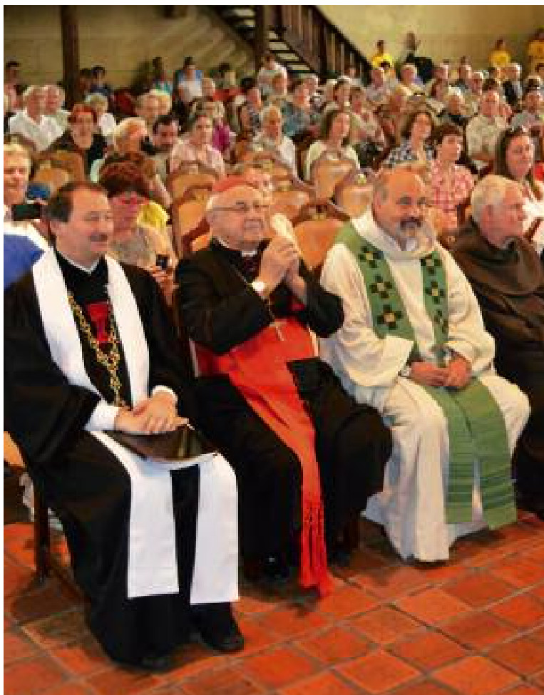
Pan kardinál Miloslav Vlk při slavnostním shromáždění naší církve v Betlémské kapli v červenci 2015

S úctou vzpomínám na Miloslava kardinála Vlka, s nímž jsme se v sobotu 25. března rozloučili při zádušní mši a při pohřebním obřadu v hrobce pražských arcibiskupů v katedrále sv. Víta, Václava a Vojtěcha - právě 10 let po rozhodnutí Nejvyššího soudu, jímž vyvrcholil tzv. spor o katedrálu, v němž se kardinál Vlk osobně angažoval. Přítomnost představitelů a zástupců křesťanských církví, ale i mnoha osobností veřejného života a tisíce věřících je dokladem vstřícných vztahů, k nimž nemalou měrou přispěl právě kardinál Vlk.